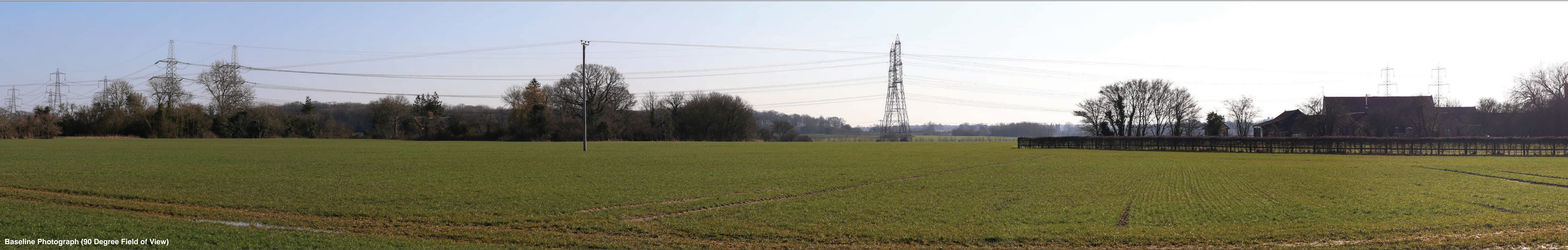
Baseline Photograph (90 Degree Field of View)