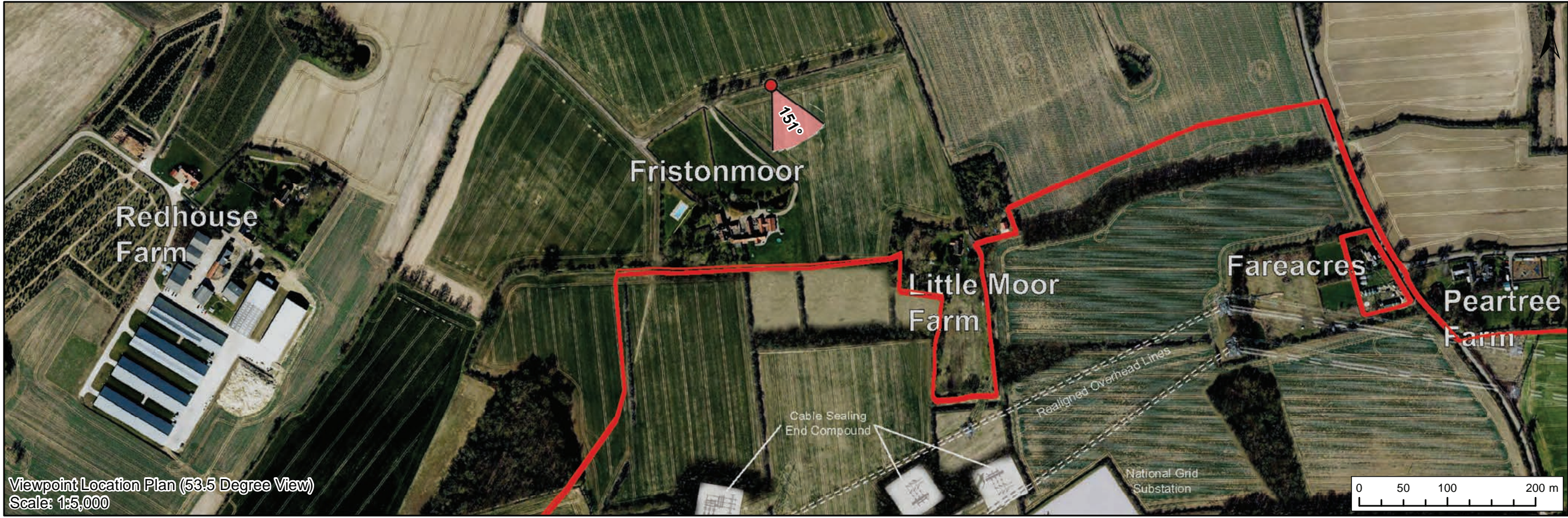
Viewpoint Location Plan (53.5 Degree View) Scale: 1:5,000