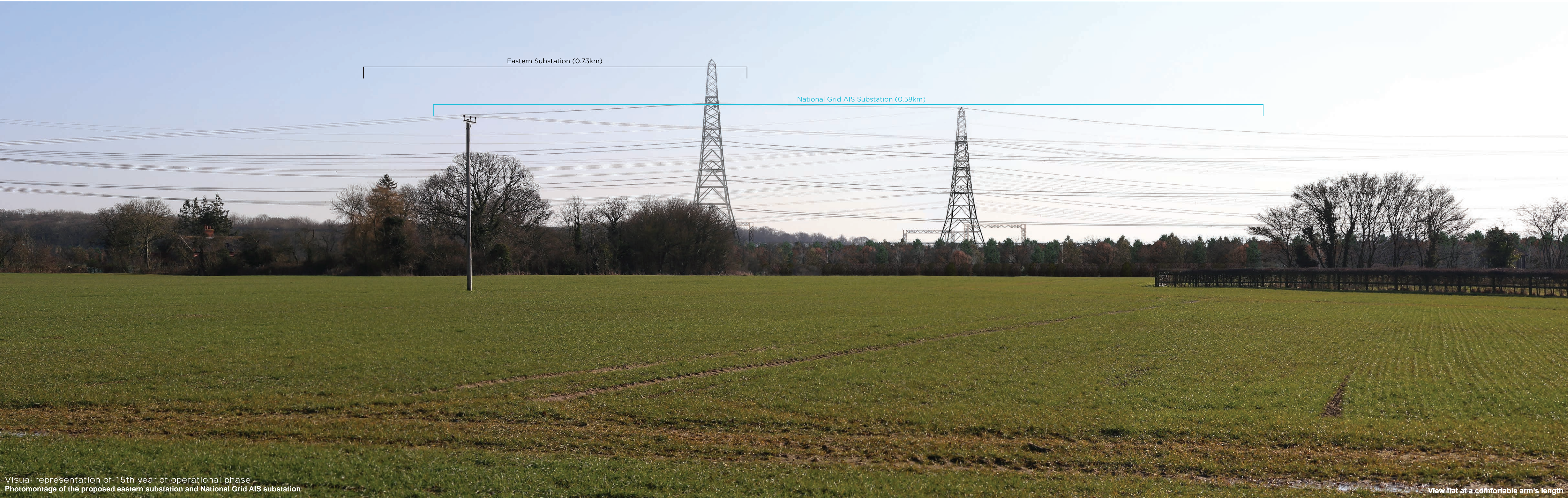
Visual representation of 15th year of operational phase Photomontage of the proposed eastern substation and National Grid AIS substation