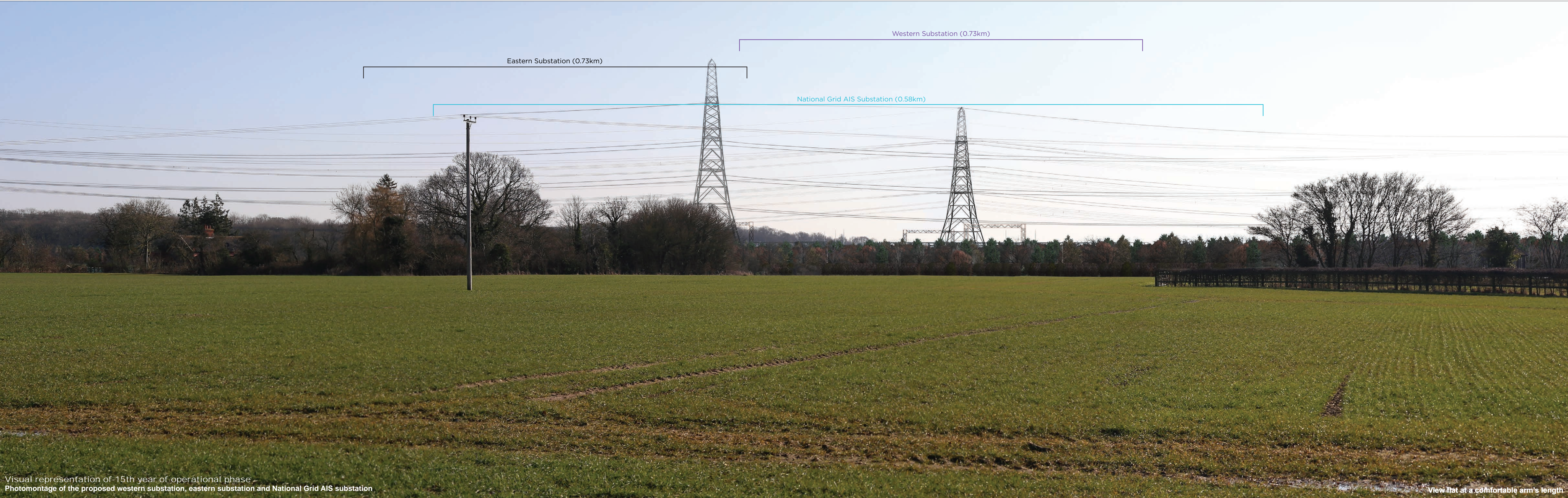
Visual representation of 15th year of operational phase Photomontage of the proposed western substation, eastern substation and National Grid AIS substation